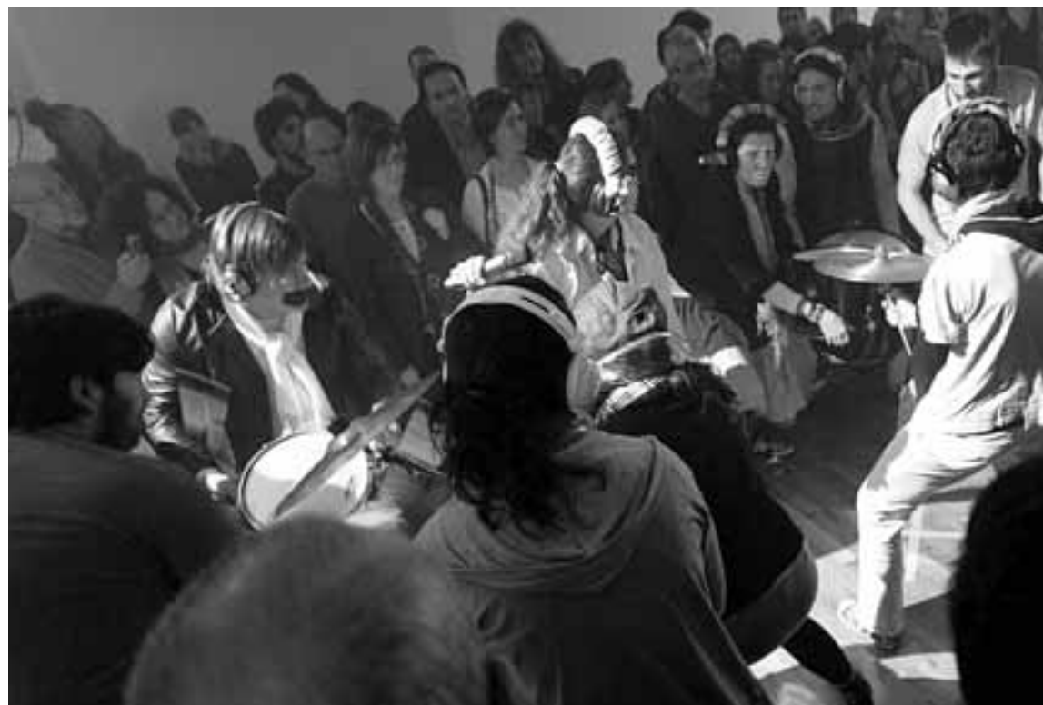
Una de las actuaciones, en medio del público.