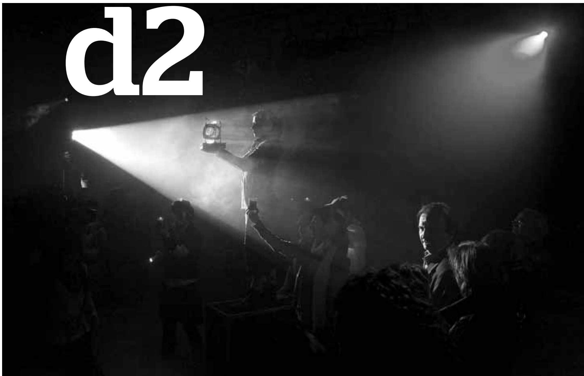
Una de las participantes en la gala lleva uno de los premios por delante de un foco.